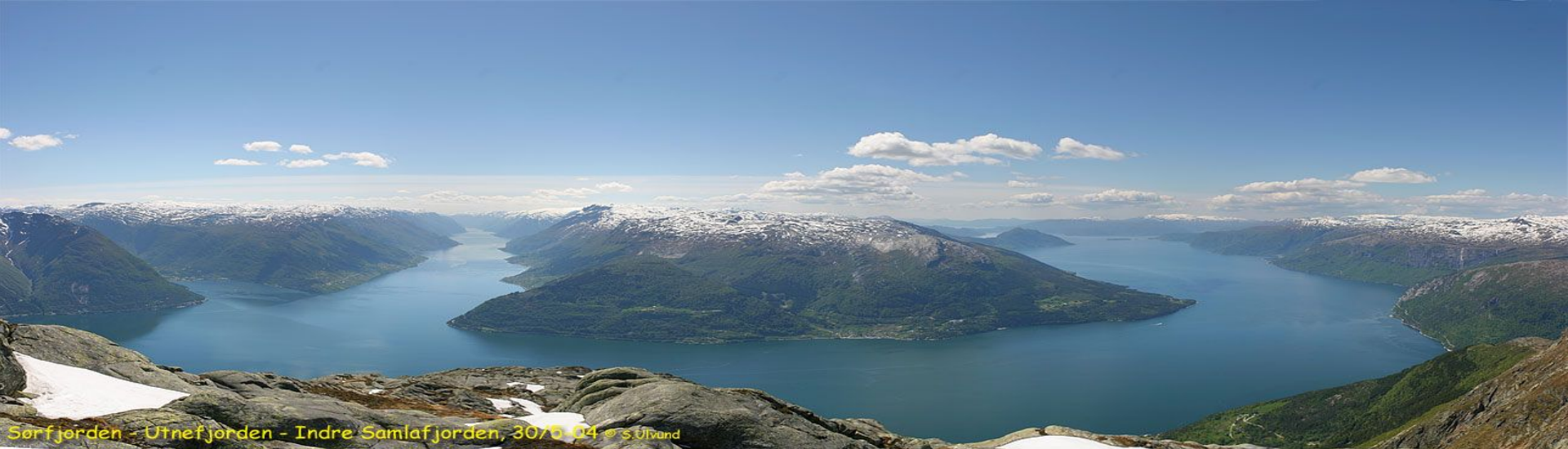
Sørfjorden - Utnefjorden - Indre Samlaffjorden, 30/0-04